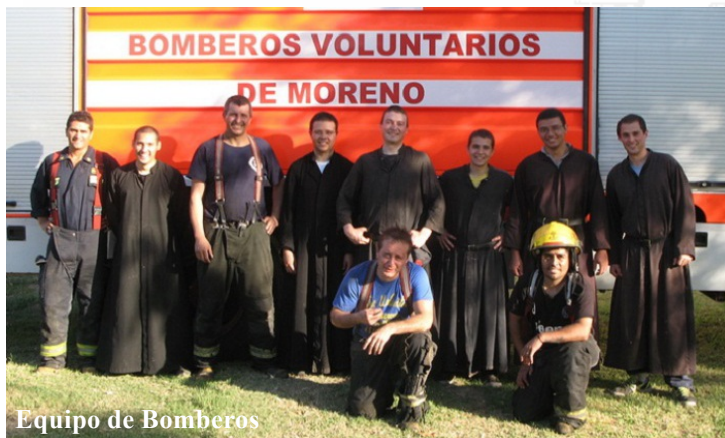
Equipo de Bomberos

En los días siguientes, llegaron los sacerdotes y seminaristas para el retiro de San Ignacio de Treinta Días , que empezó el sábado 30 con el canto del Veni Creator . Los distinguidos y versados predicadores fueron los PP. Devilliers y Gomiz, e hicieron los ejercicios 6 sacerdotes, 13 seminaristas de Teología y 1 hermano.