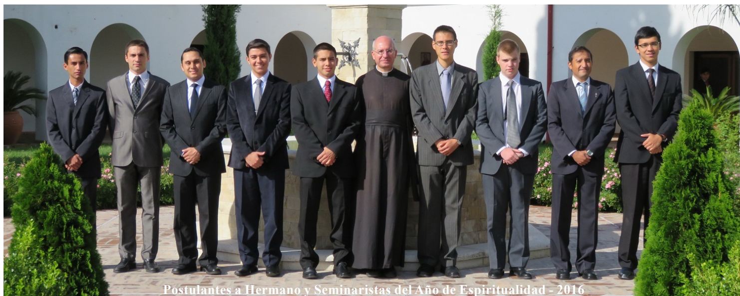
Postulantes a Hermano y Seminaristas del Año de Espiritualidad - 2016

En la Fraternidad San Pío X, los estudios se dividen en seis años de formación, iniciados con el año de Espiritualidad, en el cual el seminarista acrecienta su vida interior.