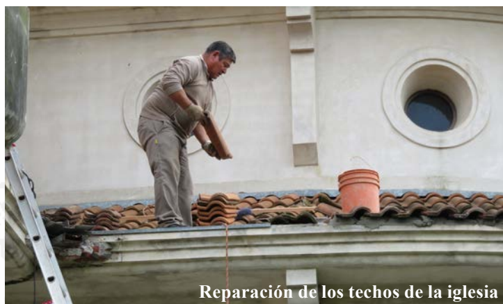
Reparación de los techos de la iglesia