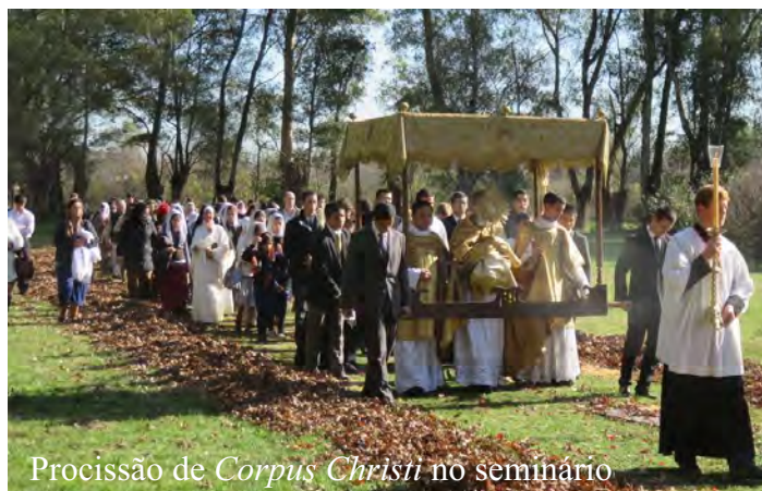
Procissão de Corpus Christi no seminário