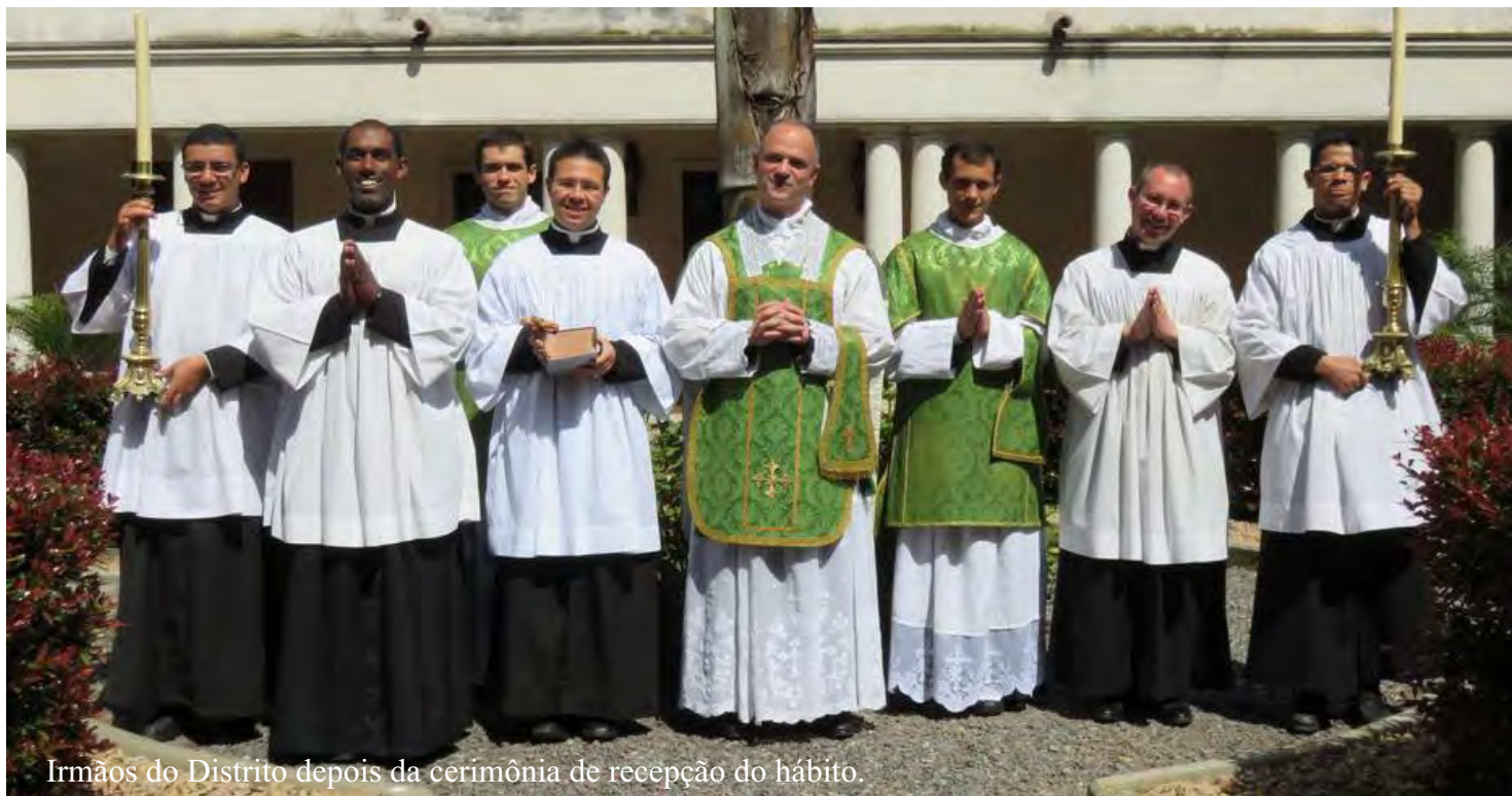
Irmãos do Distrito depois da cerimônia de recepção do hábito.