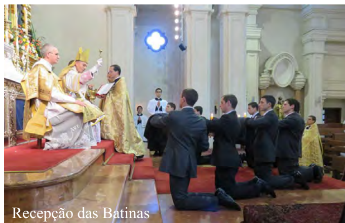
Recepção das Batinas